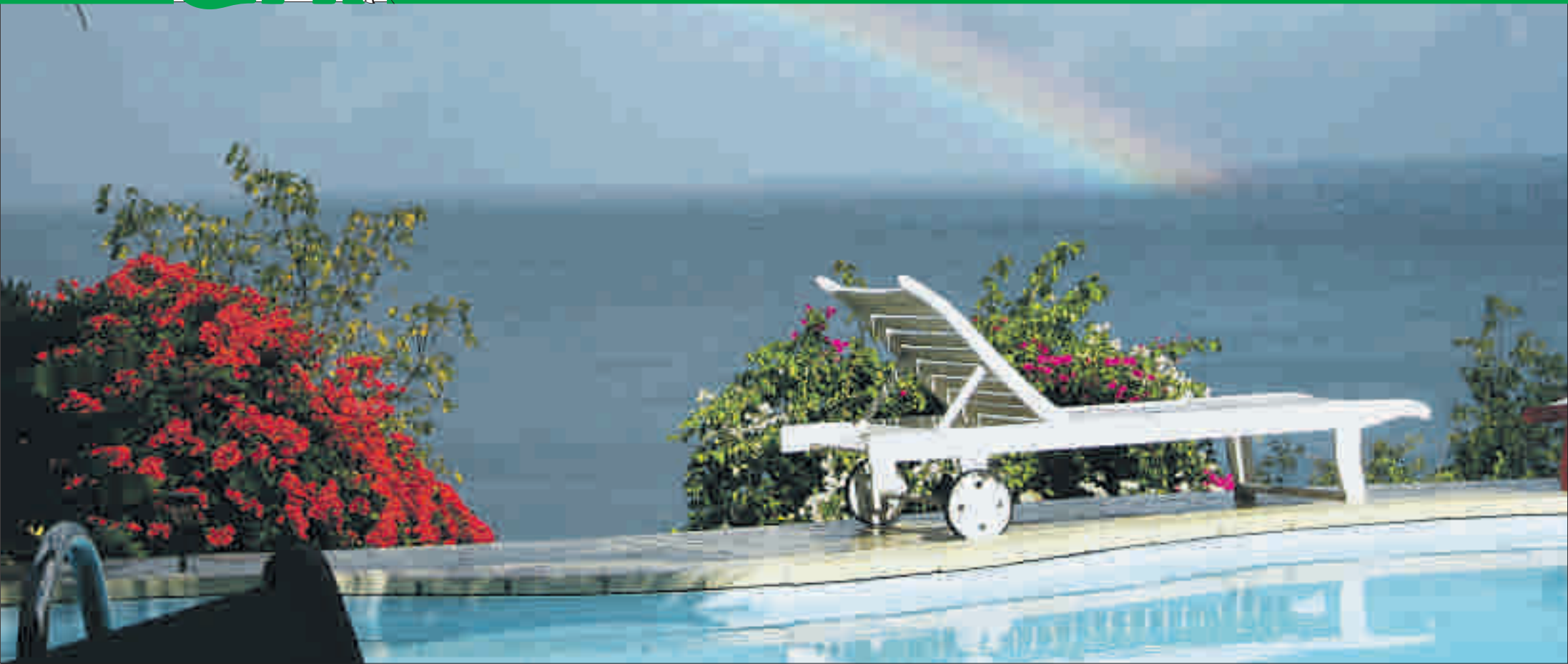
Les gîtes que l'on trouve à la Guadeloupe sont, la plupart du temps, situés dans des endroits privilégiés. PH