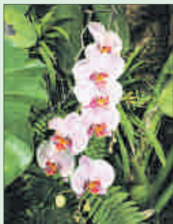
Plus d'une centaine d'espèces d'orchidées poussent en Guadeloupe.