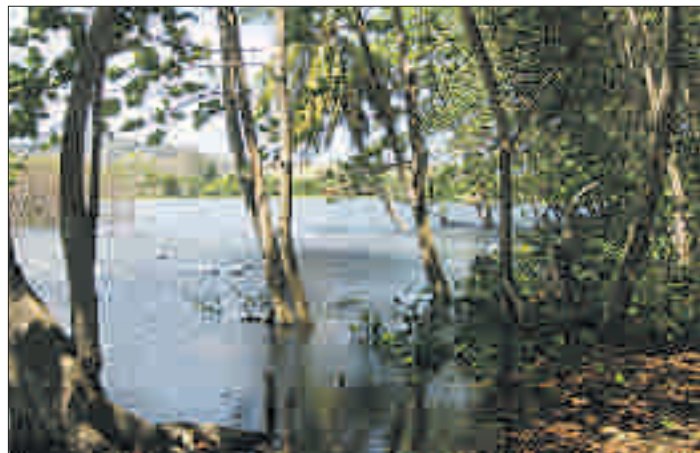
De nombreux étangs communiquent avec la mer à marée haute. PH

fonds marins sont souvent somptueux et que les eaux cristallines abritent plusieurs espèces de tortues, une quinzaine de mammifères marins ainsi qu'une quantité impressionnante de poissons tropicaux. Et comme ces activités donnent faim, les spécialités de la cuisine créole n'ont pas leur pareil pour reconforter les affamés: boudin créole, colombo de poulet, boucané de cabri, accras de morue ou poêlée de ouassous (écrevisses d'eau douce) constituent quelques-uns des fleurons d'une cuisine inventive et de qualité. ◊