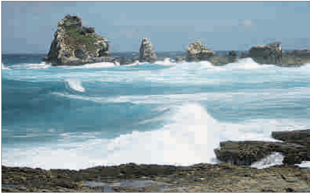
La pointe des Châteaux, ou la rencontre de la houle océane et de la terre ferme. PH

superficie de Basse-Terre, constitue un atout de poids.