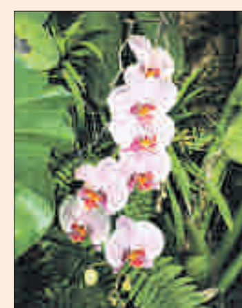
Plus d'une centaine d'espèces d'orchidées poussent en Guadeloupe.