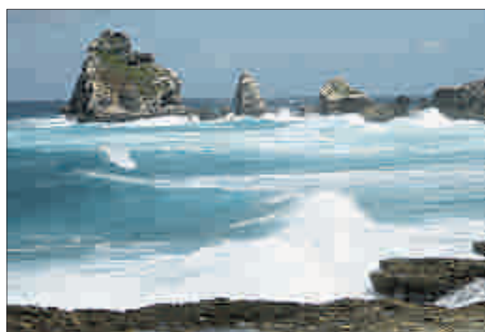
La pointe des Châteaux, ou la rencontre de la houle océane et de la terre ferme. PH

Cette vaste zone est un véritable paradis pour les botanistes avec quelque 300 espèces d'arbres et arbustes, presque autant d'espèces de fougères, dont la somptueuse fougère arborescente et une centaine de sortes d'orchidées. Les randonneurs sont également