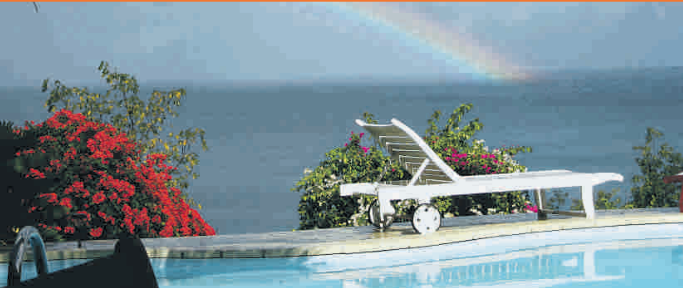
Les gîtes que l'on trouve à la Guadeloupe sont, la plupart du temps, situés dans des endroits privilégiés. PH